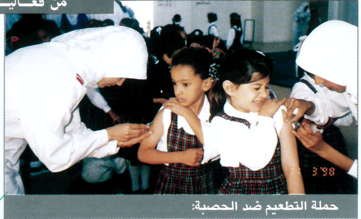
حملة التطعيم ضد الحصبة: